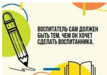
Рис. П2.2. Пример карточки с цитатой